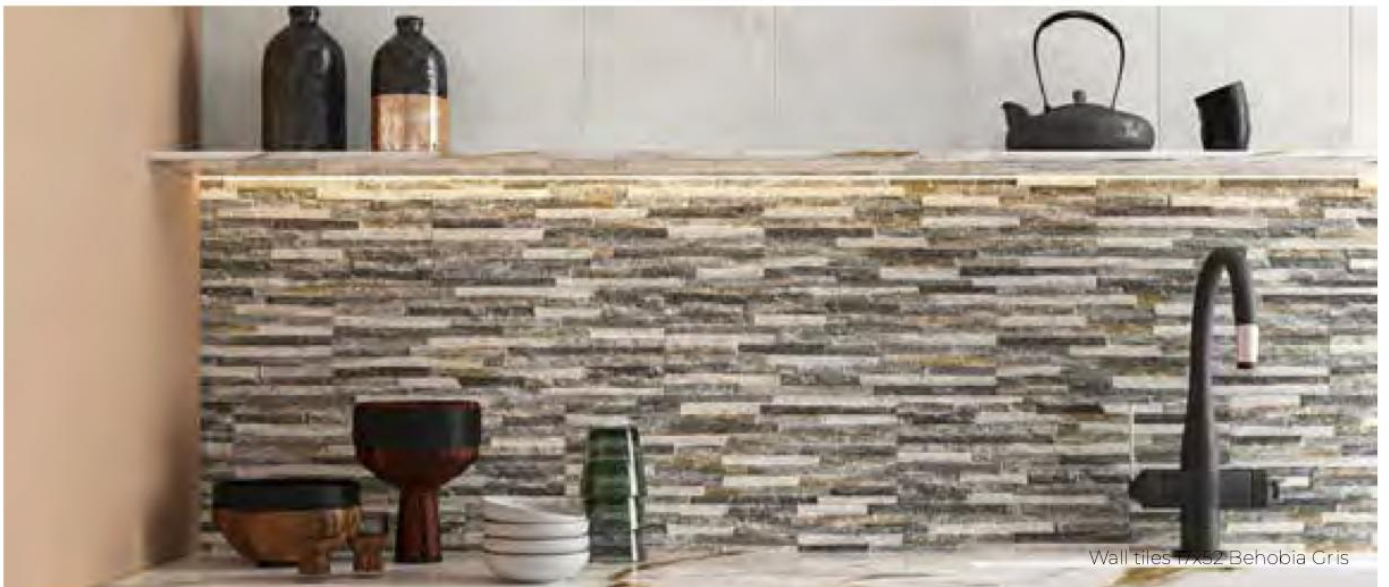
Wall tiles 17x52 Behobia Gris